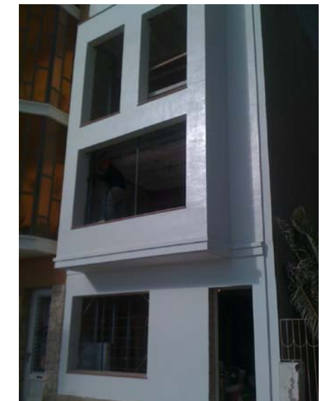
Foto ejemplo de acabado en otro color.