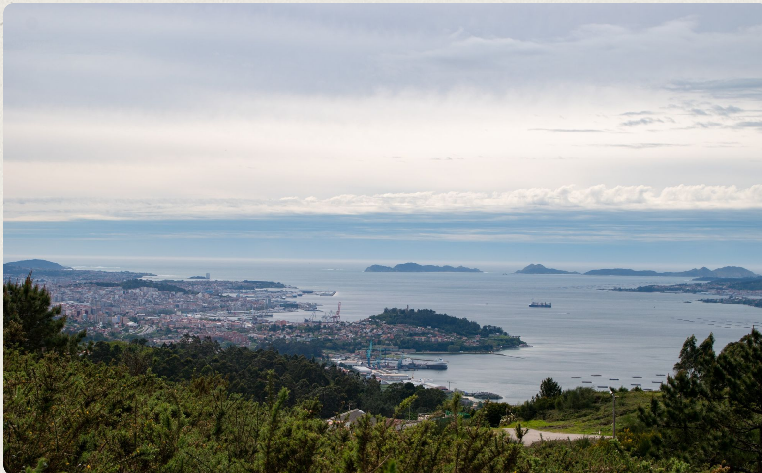
A Ría de Vigo