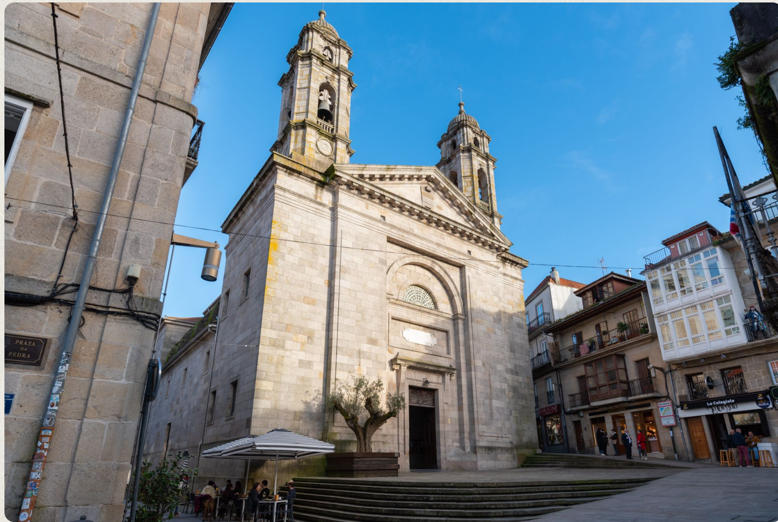
Colexiata de Santa María.

*Levantada no mesmo lugar onde se emprazaba a igrexa románica orixinal