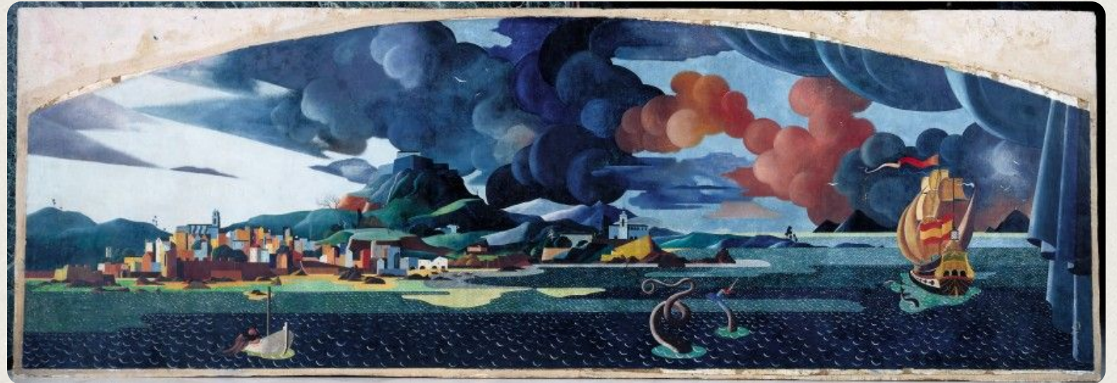
Vista de Vigo. Urbano Luguís (1953). Colección Abanca

Neste documento inclúense unha serie de actividades para afianzar e asimilar os contidos da unidade didáctica, así como material de traballo.