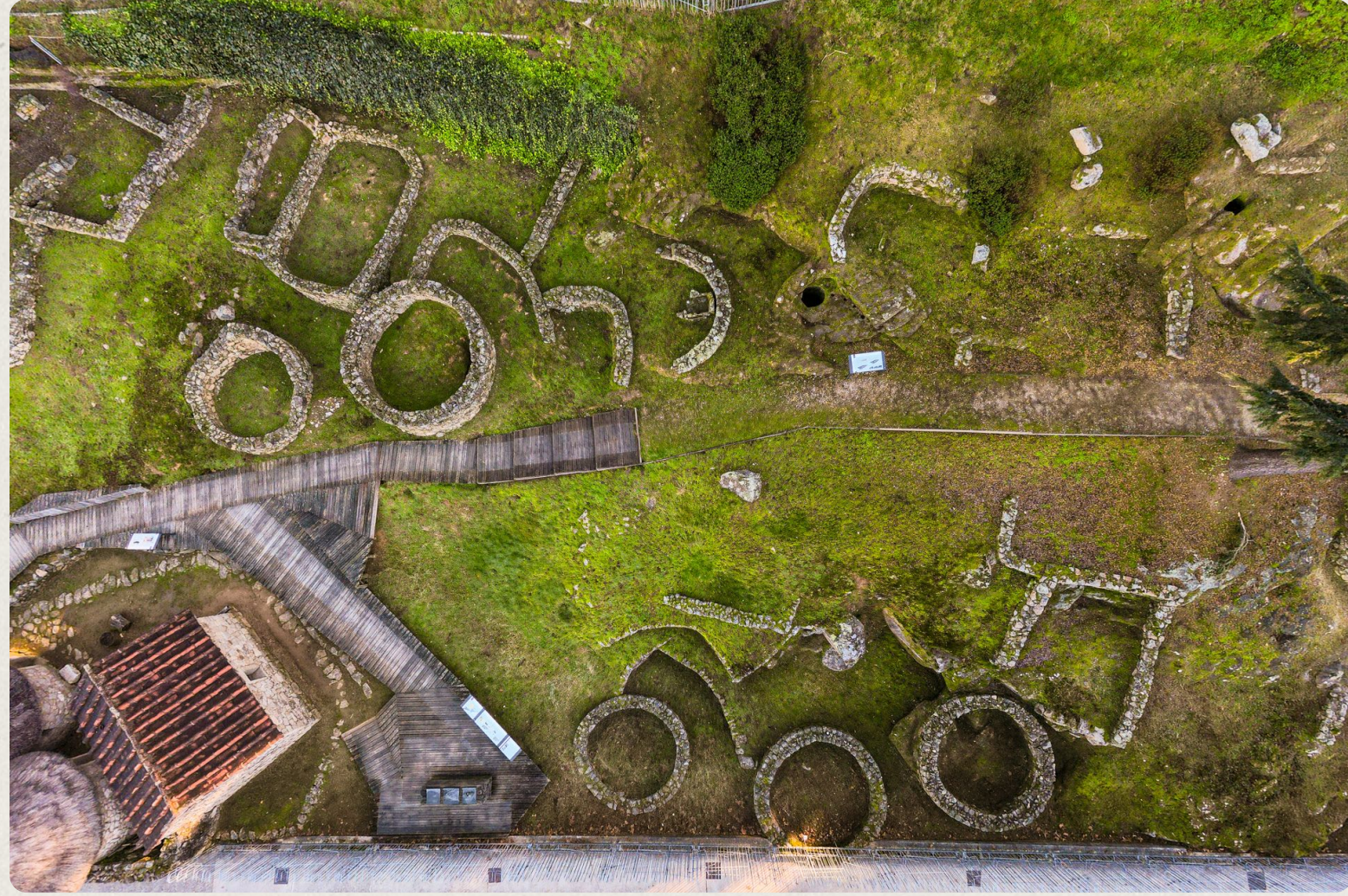
O Castro de Vigo