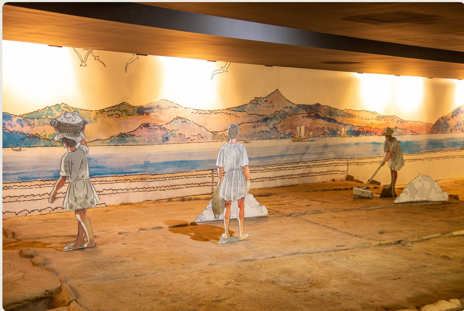
Salinas do Areal