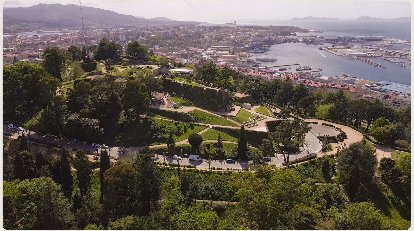
Fortaleza do Castro.