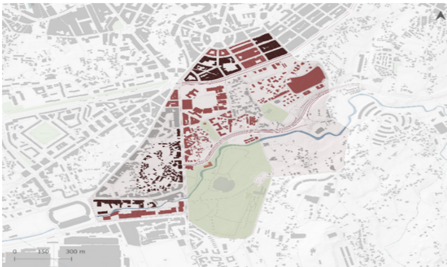
Vivienda. Porcentaje de viviendas en estado ruinoso superior al 17,5% (rojo). Porcentaje de viviendas en estado ruinoso mayor de 26% (granate).

As Travesas ha sido desde la creación de la Gran Vía en los años 60 un nodo dinámico de Vigo con la Plaza América como centro de movilidad y comercio local. Su tejido económico se beneficia de una ubicación estratégica dentro de la estructura urbana de Vigo, con acceso directo a arterias clave como la Avenida de Castrelos y Plaza América.