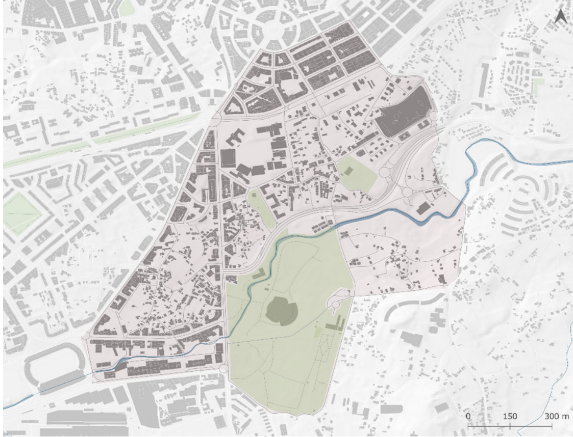
Figura 1. Delimitación del área de intervención.

El área está acotada por la Av. das Camelias y su continuidad con Av. do Fragoso, Rúa Zaragoza y Rúa de Tarragona y su continuidad con Baixada ó Castaño. En el barrio de Castrelos limita con Av. do Alcalde Portanet, el límite del Parque de Castrelos y la Subida Costa.