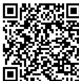
Ilustración 1: QR Acceso a trámite de solicitudes

Co fin de optimizar os desprazamentos e as citas programadas cada xornada, buscarase combinar os centros e aulas de modo que se poidan atender cos recursos dispoñibles, e ao mesmo tempo, tratarase de adaptalas as preferencias da escola ou instituto solicitante, na medida posible. Calquera modificación será acordada co centro escolar.