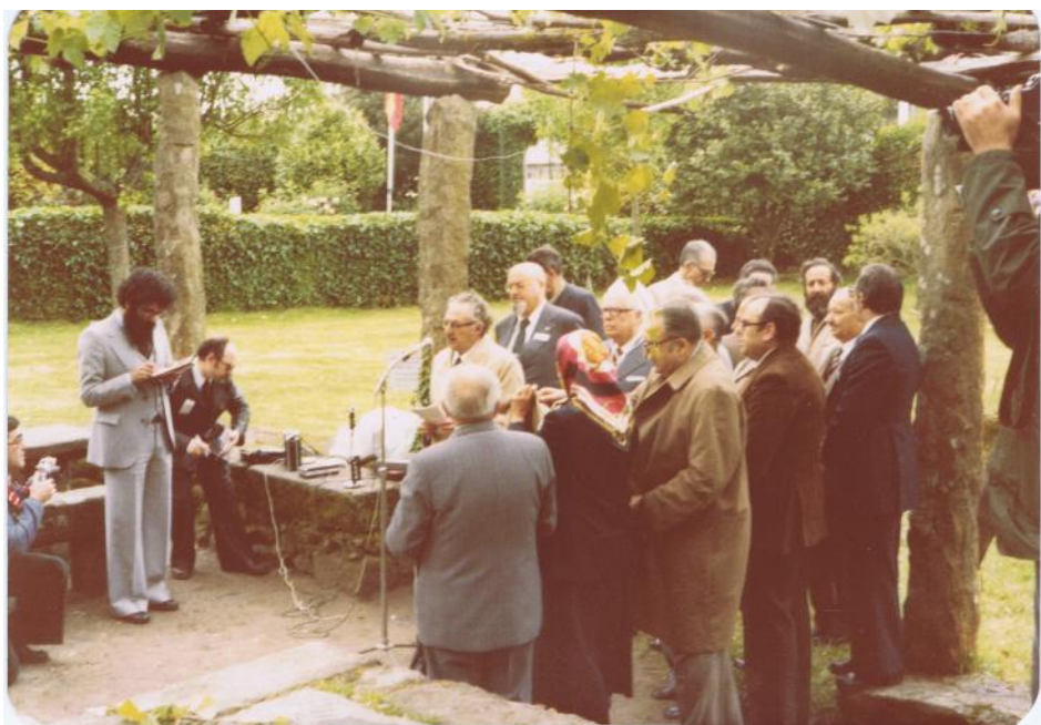
Pedrón de Ouro, 1979

No ano 2008 foi homenaxeado coa dedicación do Día das Letras Galegas.