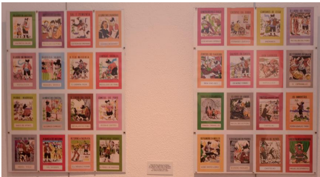
Os libriños da colección O Moucho tiveron un importante papel de divulgación da cultura popular galega.

En 1966 trasládase coa familia a Oviedo como axente de vendas de Pescanova, regresando en 1967 a Vigo, onde funda a editorial Castrelos para dedicarse profesionalmente á edición. Nela publica coleccións de éxito como Pombal e O Moucho.