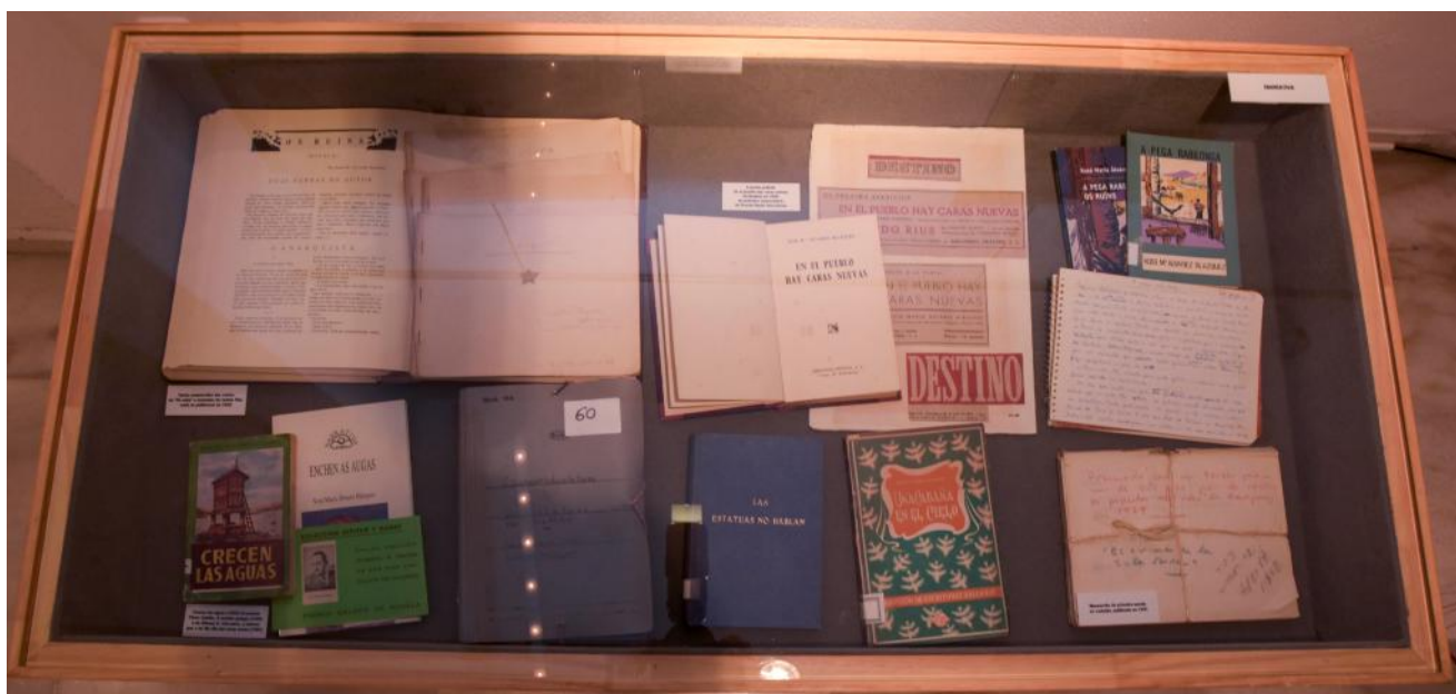
Novelas de XMAB con algún manuscritos orixinais.