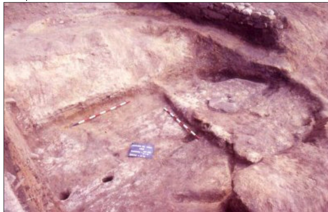
Fotografía da campaña de escavación de 1986.