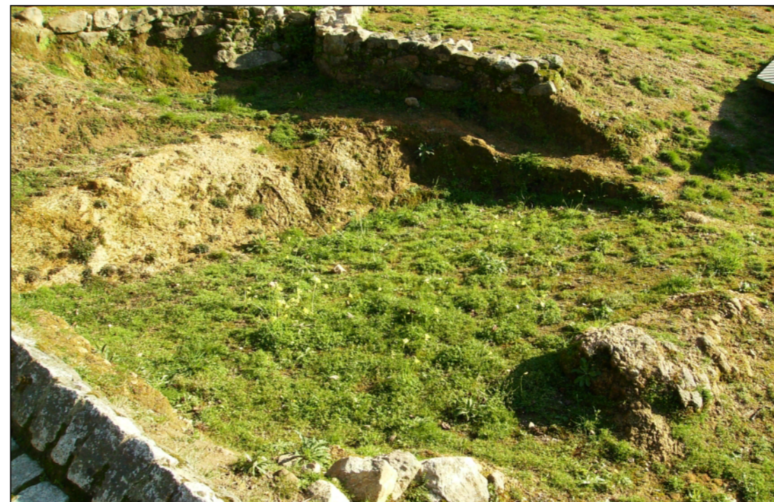
Fotografía actual, trato proceso de musealización.